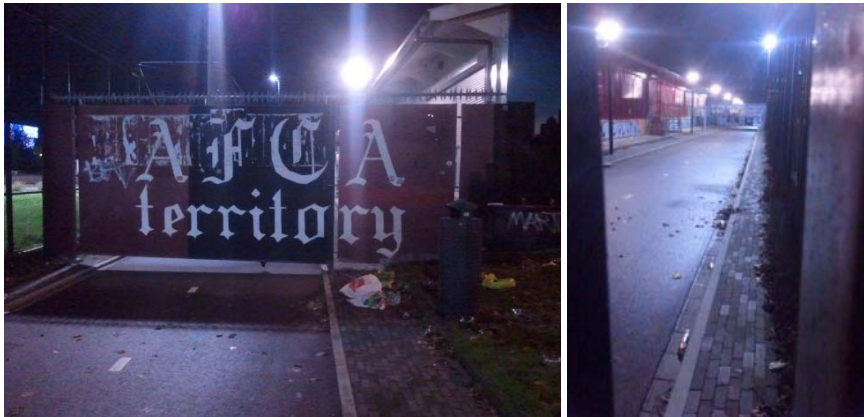
oude fietspad is busbaan geworden: