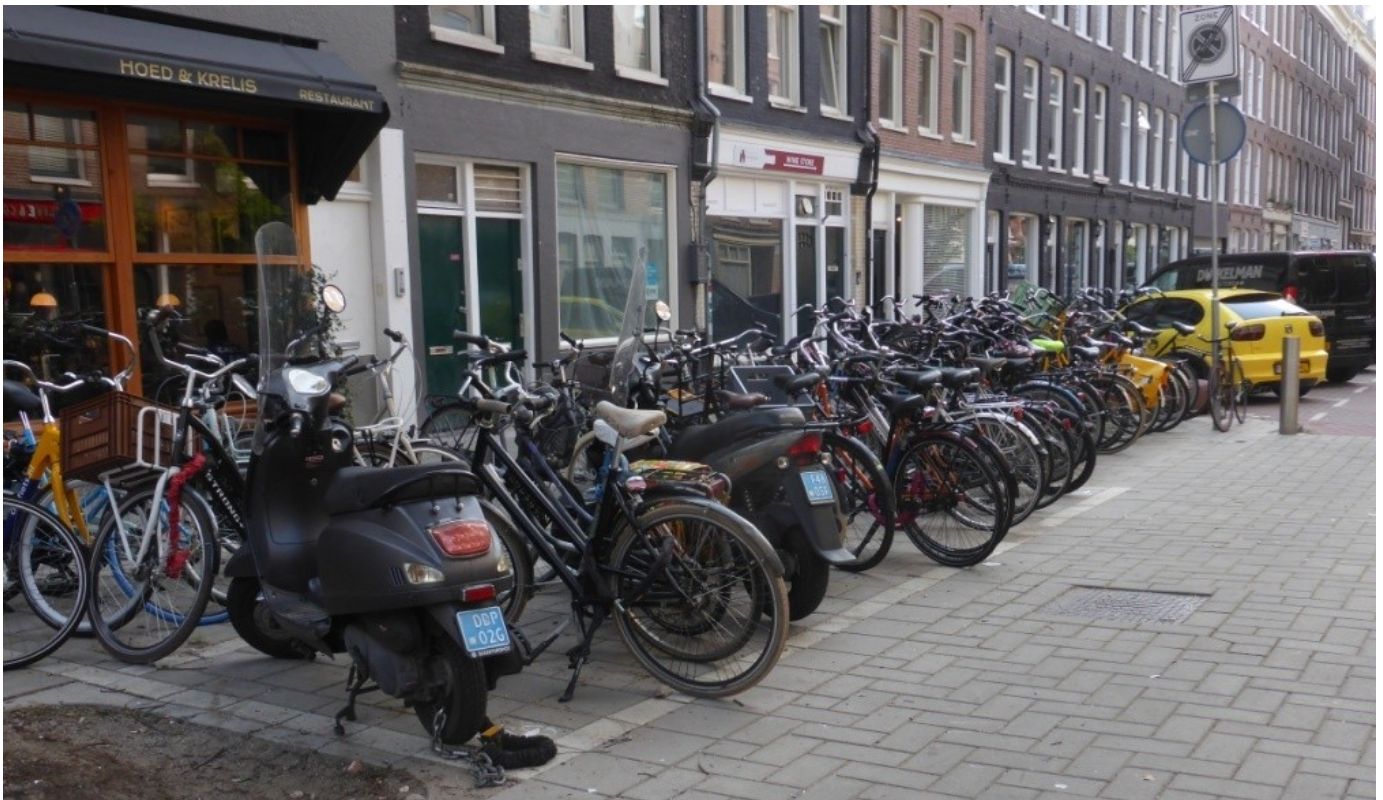
Foto 6: Tussen Albert Cuijp en Heinekenplein: onvoldoende vakken beschikbaar, wel ruimte voor extra.