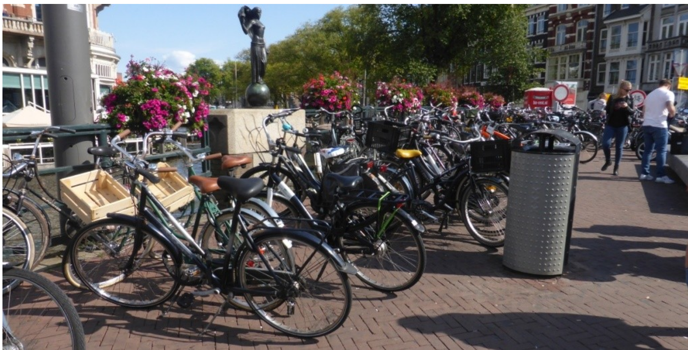
Foto 12: Muntplein: onvoldoende kortparkeren. Fietsers staan niet hindeljk geparkeerd: hier zouden vakken kunnen komen (maar scooters wel).