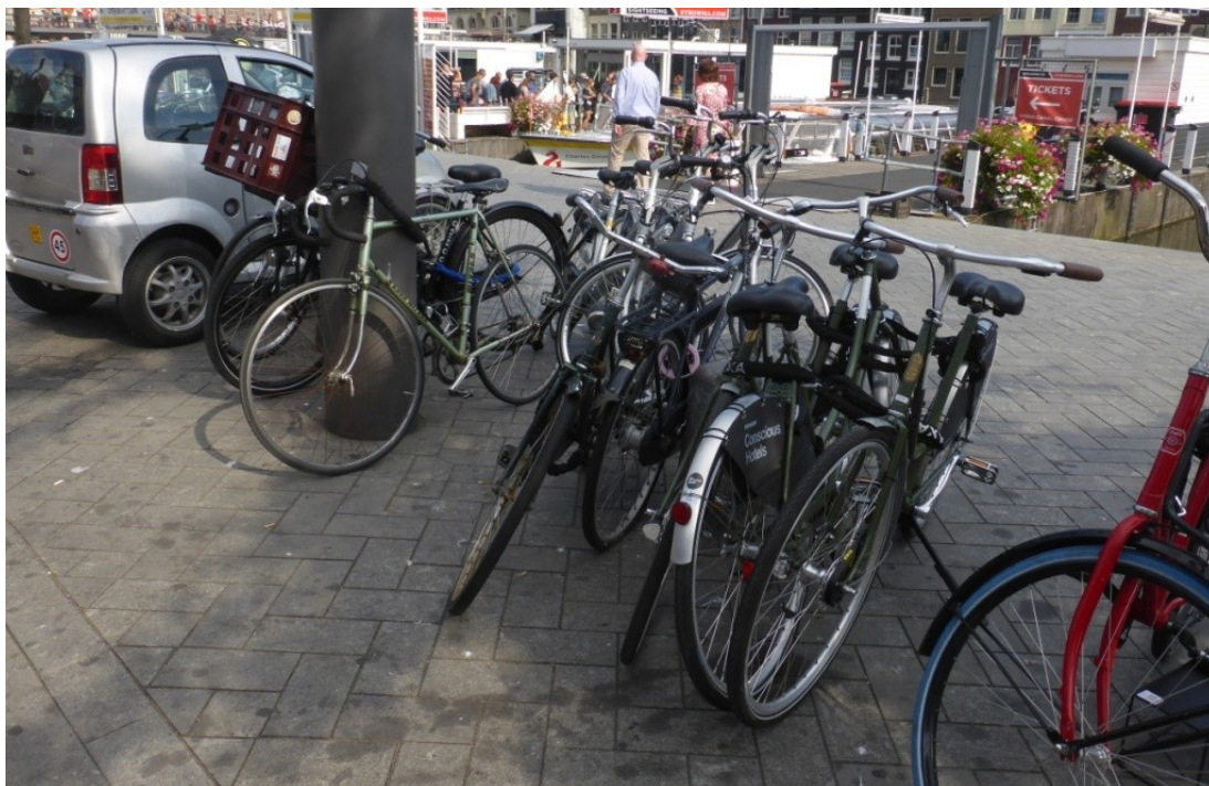
Foto 27: Cornelis Troostplein: Tekort aan kortparkeer ruimte, niet hinderlijke vakken wel mogelijk