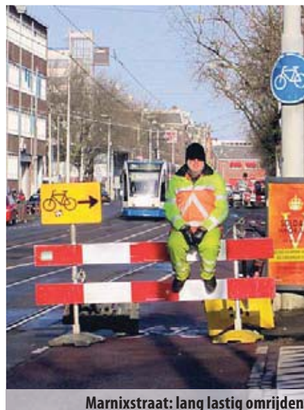
Marnixstraat: lang lastig omrijden

De trambaan langs de Marnixstraat tussen Leidsegracht en Rozengracht is vernieuwd. Dat was behoorlijk lang vervelend omrijden, maar nu het af is, blijft ook dat er een extra randje is ontstaan tussen trambaan en fietspad. Het fietspad is daardoor in het gebruik smaller geworden en op een aantal plekken ook nog steeds erg beschadigd door opdrukkende boomwortels. We zijn hier erg ongelukkig mee, want het gaat hier wel om een van de drukste fietsroutes van de stad.