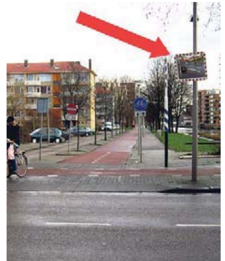
lastige spiegel Albardagracht

zicht. Het mooiste zou een aanpassing van het kruispunt zijn, maar dat kwam niet van de grond. Er is nu een spiegel geplaatst. Daarmee kan je de auto's zien aan komen, tenminste als je weet dat die spiegel er is en je goed in die spiegel kijkt. Maar dat laatste is lastig. Een echte oplossing van dit knelpunt kunnen we het dus niet noemen. Bij de Colijnstraat is een vergelijkbaar slecht zicht.