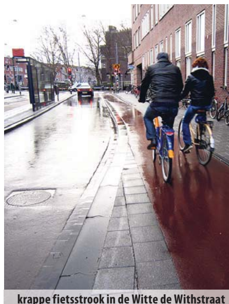
krappe fietsstrook in de Witte de Withstraat

jesweg tegenover Het Sieraad is aangepakt, o.a. met een stukje nieuw fietspad. Ook is de aansluiting van de Baarsjesweg op deze kruising ruimer geworden en voorzien van een OFOS. Een hele verbetering, al blijft er nog van alles te wensen over. Zo is de blokmartering op de rode fietsloper langs de monding van de Witte de Withstraat te smal uitgevoerd en is de ruimte op de brug stad-uit nog steeds veel te krap. Ook te krap is de zeer smalle fietsstrook op de Witte de Withstraat naar de kruising toe, wat beslist voor problemen zal zorgen wanneer de onvermijdelijk lange stroom achter elkaar overstekende fietsers het geduld van de automobilisten die rechtsaf willen op de proef gaat stellen. Daar was een OFOS niet alleen de veiligheid maar ook de wegcapaciteit ten goede gekomen.