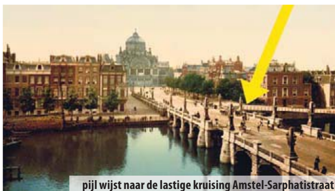
pijl wijst naar de lastige kruising Amstel-Sarphatistraat